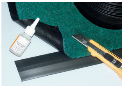
Randanbringung bei Rollenware möglich