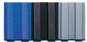
blau schwarz grau

Art Nr.: Größen: Rollenware: 100 x 1000 cm Stärke: 4 mm kg: 4,0 kg/lfm Farbe: