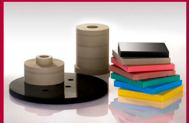
Technische Schäume zur Schwingungsisolierung