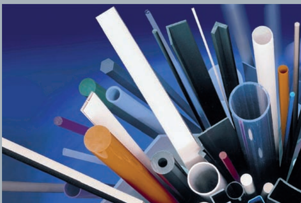
Hohlstäbe, Profile, Rohre und Vollstäbe aus allen erdenklichen Thermoplasten