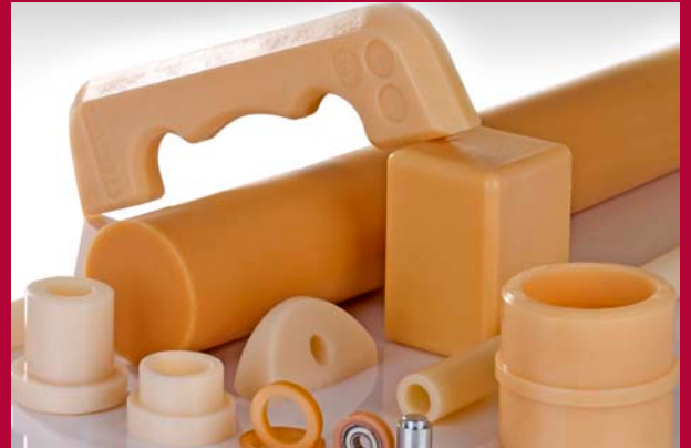
Zuschnitte und Fertigteile aus Vulkollan und Polyurethan