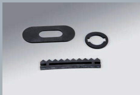
Elastomer-Stanzdichtungen aus EPDM