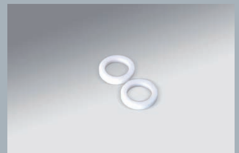
gedrehte Dichtungen aus PTFE