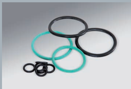
O-Ringe aus diversen elastomeren Werkstoffen