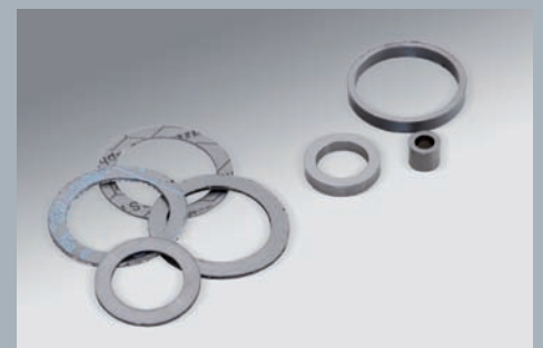
Reingraphit- und Graphit-Laminat-Dichtungen