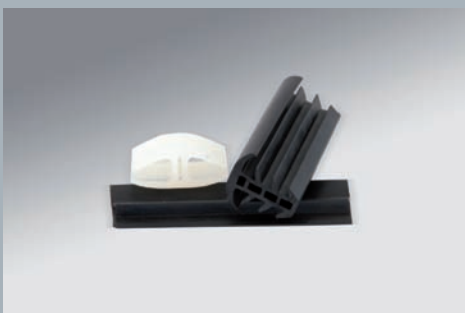
Elastomerprofile aus EPDM und Silikon