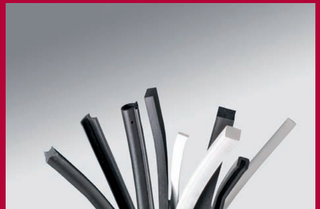
Elastomere Dichtungsprofile aus Weich- und Schaumgummi