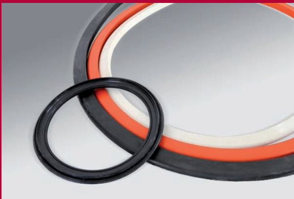
Behälter-/Deckeldichtungen aus diversen Elastomeren