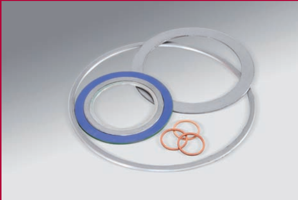
Spiral- und Kammprofildichtungen mit verschiedenen Auflagen